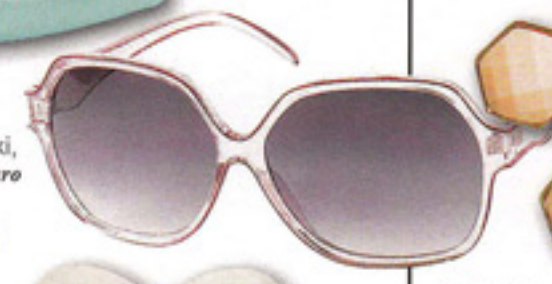
LA VIE EN ROSE Squint über Topshop, ca. 29 Euro; 01 324