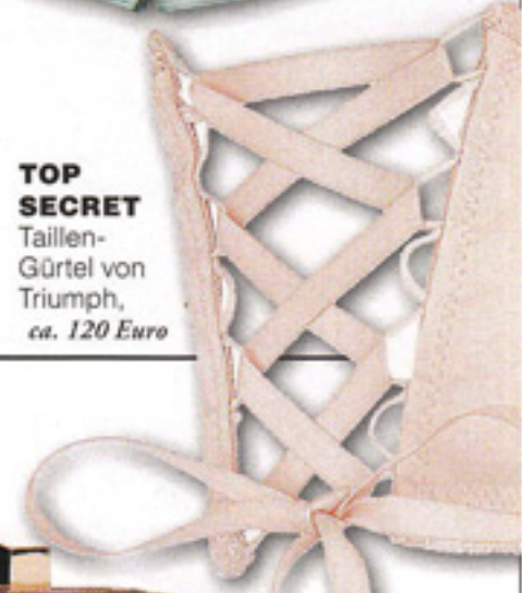
TOP SECRET Tailen- Gürtel von Triumph, ca. 120 Euro