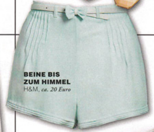
BEINE BIS ZUM HIMMEL H&M, ca. 20 Euro