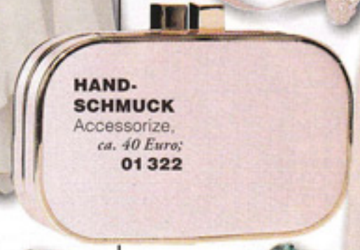
HAND-SCHMUCK Accessorize, ca. 40 Euro; 01 322