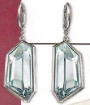
GLITZERT WIE DAS MEER Swarovski, ca. 125 Euro; 01 314