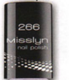
VEILCHEN-FARBEN „Wonderland“ von Misslyn, ca. 5 Euro