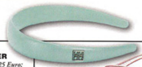
GOOD HAIR DAY Celia Czerlinski, ca. 95 Euro