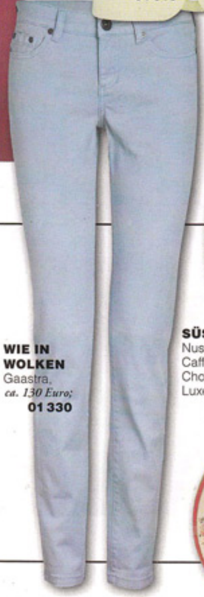
WIE IN WOLKEN Gaastra, ca. 130 Euro; 01 330