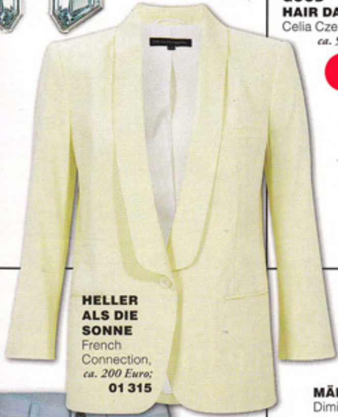
HELLER ALS DIE SONNE French Connection, ca. 200 Euro; 01 315